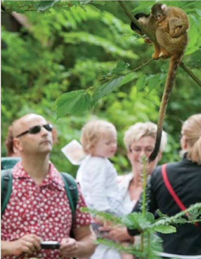
AFFENPARK APENHEUL, NIEDERLANDE Bolivianische Totenkopffaffen

ermöglichen. Im Gehege sollten Management- und Haltevorrichtungen wie Waagen, Fangkisten und Zwangsstände vorhanden sein, so dass die Tiere durch Belohnungs-Training einfacher an nicht-invasive medizinische Prozeduren gewöhnt werden können. Physische und Landschaftscharak-