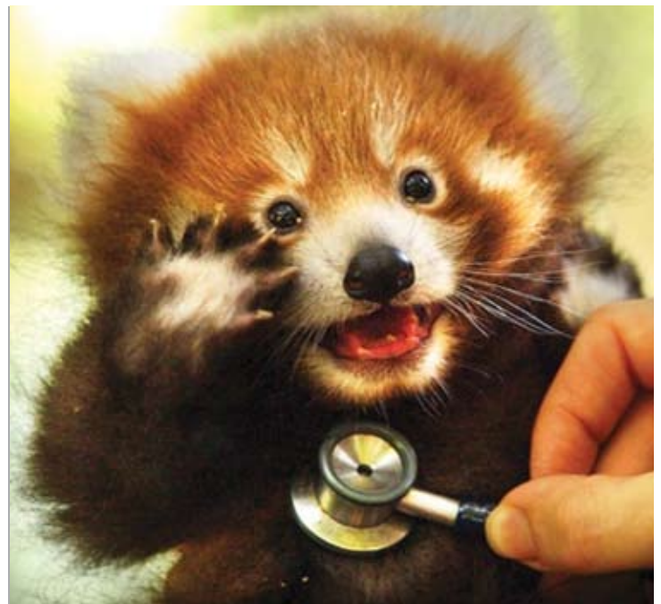
ZOO PERTH, AUSTRALIEN

Die Einschätzung der tiergerechten Haltung ist ein entscheidender Bestandteil moderner Tierpflege in Zoos und Aquarien. Die Bewertungskriterien verwenden viele Aspekte und Hinweise, die auf der physikalisch/funktionalen Verfassung und dem Verhalten basieren und mit negativen und/oder positiven Erlebnissen der Tiere in Beziehung stehen.