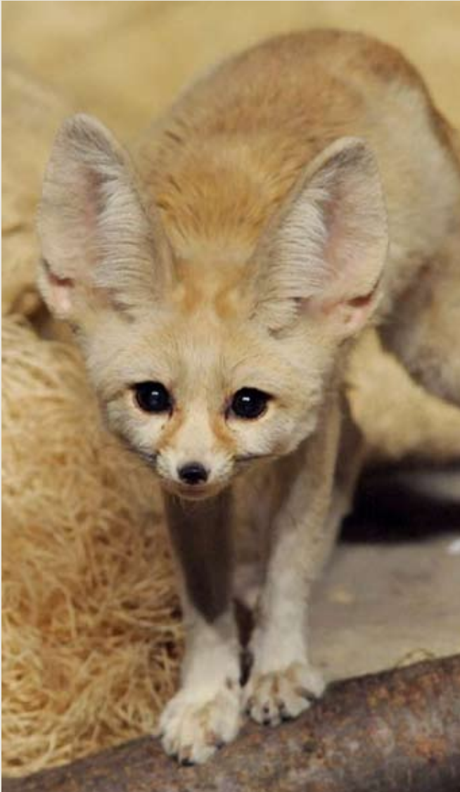
ZOO BROOKFIELD, IL, USA Fennek