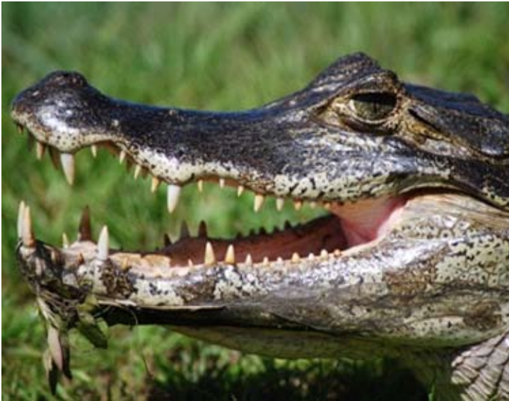
PANTANAL, BRASILIEN, Kaiman

Viele gesellschaftliche Erwartungen, was akzeptabel und inakzeptabel bei der Behandlung von Tieren ist, haben sich verändert, weil das Verständnis ihrer Bedürfnisse gewachsen ist. In der Öffentlichkeit besteht ein großes Interesse, ob Tierschutzstandards eingehalten werden, wenn Naturschutzmaßnahmen im Freiland durchgeführt werden.