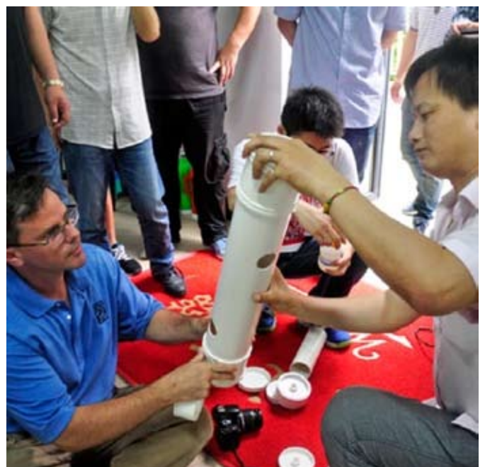
Mitarbeiter des Zoo Houston zeigen Zoo Hangzhou Pflegern, wie man PVC-Röhren zu Environment Enrichment nutzt.

Schlechte Zoos und Aquarien können von Partnerschaften profitieren, indem sie gemeinsames Wissen und Kompetenzen nutzen. Solche Hilfestellungen können Verbesserungen im Tierschutz und in den Betriebsabläufen bringen, und langfristig zu positiven Einstellungen zum Wohlergehen der Tiere innerhalb der unterstützten Institution führen. Partnerschaften können die Lebensbedingungen einzelner Tiere verbessern und durch praktische Lösung von Tierschutzproblemen, das Engagement der Zoo- und Aquarium Gemeinschaft für Tierschutz verdeutlichen und die öffentliche Wahrnehmung positiv beeinflussen.