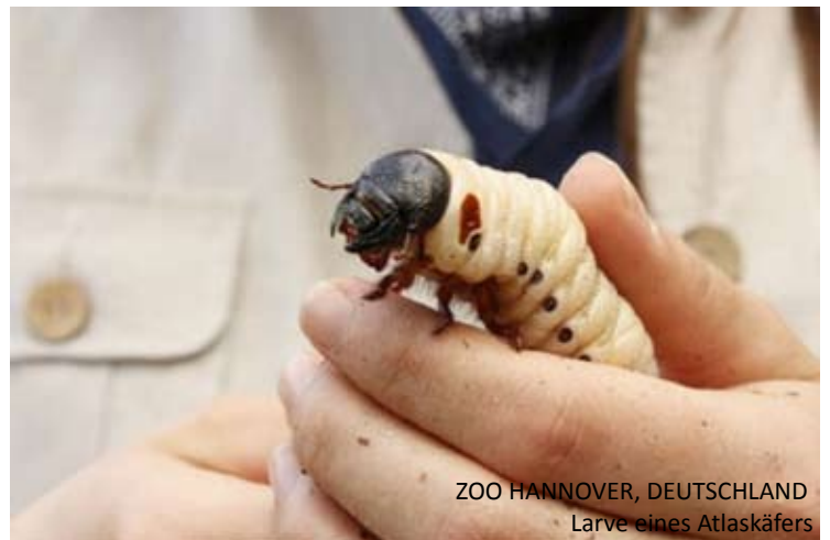
ZOO HANNOVER, DEUTSCHLAND Larve eines Atlaskäfers

Es ist offensichtlich, dass das integrierte Management von Arten innerhalb und außerhalb ihrer natürlichen Lebensräume immer wichtiger wird.