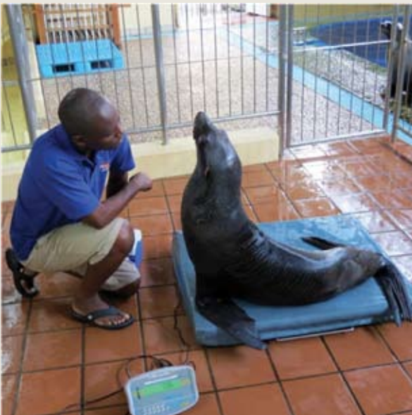
uSHAKA SEA WORLD DURBAN, SÜDAFRIKA Südafrikanischer Seebär

Die Kontrolle der Tierhaltung und ihre Bewertungskriterien sind entscheidende Komponenten einer modernen Tierhaltung in Zoos und Aquarien. Beobachtungsprogramme können verschieden gestaltet sein, aber sie sollten Hinweise nutzen, die auf physischen/funktionalen Gegebenheiten und auf Verhaltensweisen basieren, die mit negativen und/oder positiven Erfahrungen des Tieres assoziiert sind. Traditionell lag der Schwerpunkt guter Tierhaltung auf der Unterbindung negativer Einflüsse, jetzt aber gewinnt die Förderung von Wohlergehen an Bedeutung. Beobachtungen, die Hinweise auf das Wohlergehen nutzen und Aufzeichnungen darüber sind wichtige Komponenten eines effektiven Managements des Wohlergehens, das Tiere aller Altersklassen innerhalb der Einrichtung einbezieht. Die Einführung von neuen Methoden in der Tierhaltung, wie das positive Verstärkungstraining und das ständig wachsende tiermedizinische Wissen, ermöglichen diese Fortschritte.