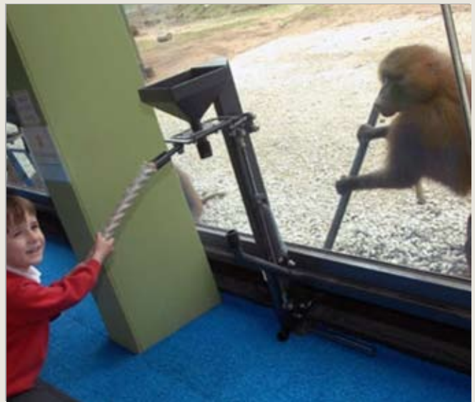
YORKSHIRE WILDLIFE PARK, UK Guinea Pavian

Die Forderung, negativen Einfluss auf das Wohlergehen zu minimieren, hat unmittelbar Einfluss auf jede Forschung in