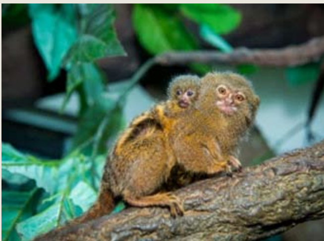
ZOO HOUSTON, TX, USA Zwergseidenäffchen

Ein guter Bestandsplan basiert auf der Übereinkunft von Naturschutz- und Artenmanagement. Damit wird sichergestellt, dass sowohl die genetische als auch die demografische Integrität von Zoo- und Aquarienpopulationen bzw. Wildtierpopulationen gewährleistet wird. Somit können Zoos und Aquarien auch die Besucher über Natur- und Tierschutz informieren.